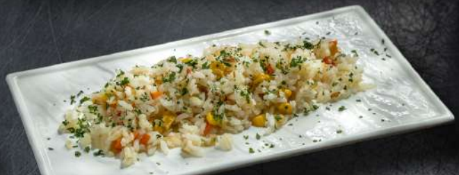
Рис с овощами

Отварной рис со сладкой кукурузой и болгарским перцем