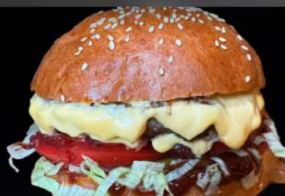
Бургер Инегель Чиз

Бургер с сочной котлетой, сыром чеддер, хрустящим салатом айсберг, карамелизированным луком, томатами, маринованными огурцами и соусами барбекю и сырным